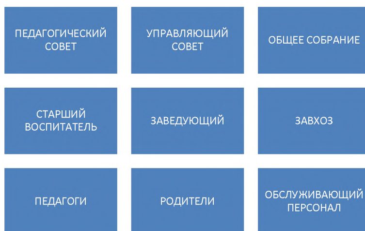
Схема управления МБДОУ №1

Образовательная политика учреждения направлена на обеспечение доступности и качества образования. Основным источником информации для анализа состояния деятельности учреждения является контроль.